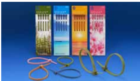
2022台湾精品奖产品 (此超值包装型号: DP-5-DLC200)