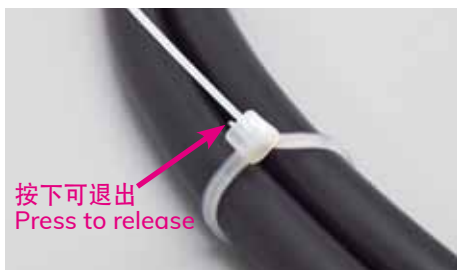
按下可退出 Press to release