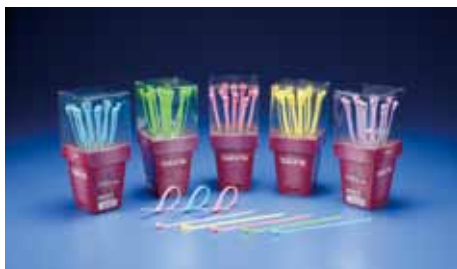
2019台湾精品奖产品 (此超值包装-活力小盆栽型号: PC-12-HV150S)